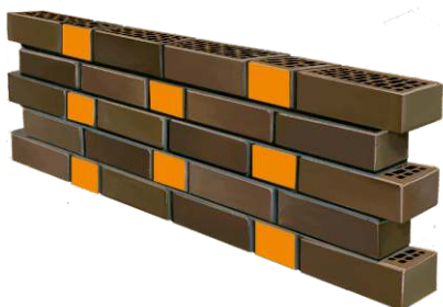
1 ЦЕПНАЯ КЛАДКА