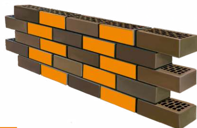
2 ЛОЖКОВАЯ КЛАДКА СМЕЩЕНИЕ НА 1/2 КИРПИЧА