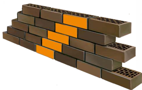
3 ЛОЖКОВАЯ КЛАДКА КОСОЕ СМЕЩЕНИЕ НА 1/4 КИРПИЧА